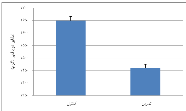
شکل ۲- میانگین غذای دریافتی دو گروه کنترل و تمرین طی ۱۲ هفته پروتکل تمرینی (بر حسب گرم)

شکل ۲، میانگین غذای دریافتی دو گروه تمرین و کنترل را بعد از شروع پروتکل تمرینی نشان می‌دهد. آزمون T مستقل نشان داد تفاوت معناداری ( P = 0.028 ) در میانگین غذای دریافتی دو گروه طی ۱۲ هفته پروتکل تمرینی وجود داشت.