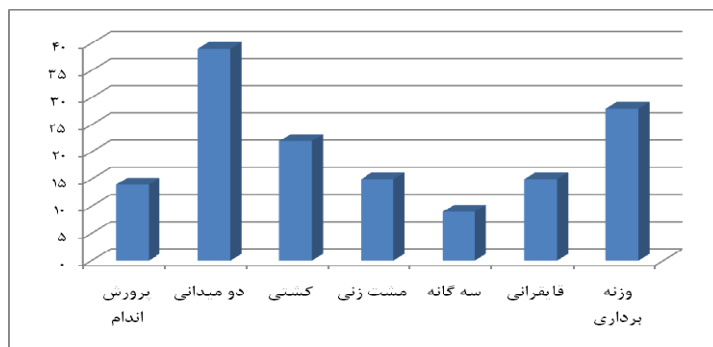
شکل ۱ - تعداد ورزشکاران رشته های مختلف ورزشی شرکت کننده در تحقیق

در بین باشگاه های ورزشی استان، باشگاه ورزشی تختی به عنوان باشگاه ورزشی زیر نظر فدراسیون که محل تمرین ورزشکاران نخبه استانی است و دوره های آموزشی، تمرینی و فضای ورزشی مورد نیاز برای تمرینات اغلب رشته های ورزشی مطرح استان را دارد، به عنوان محل انجام بررسی انتخاب شد. برای اجرای این تحقیق، پس از جلب همکاری مسئولان باشگاه و مربیان تیم های ورزشی، پرسشنامه ها برای تکمیل به ورزشکاران ارائه شد. از ۱۸۰ پرسشنامه توزیع شده، ۱۵۰ پرسشنامه تکمیل (نسبت پاسخگویی ۸۴ درصد) و در آنالیز آماری استفاده شد. شکل ۱ تعداد شرکت کنندگان در تحقیق را به تفکیک رشته ورزشی را نشان می دهد.